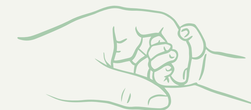
Doc. 1. Grafika wygenerowana z użyciem narzędzi AI na podstawie naturalnych kadrow z materiału wideo. Ryzy tworzy i cechy identyfikujące bohaterów zostały zmienione w celu anonimowości. Ilustracja nie stanowi materiału źródłowego do analizy, lecz służy wizualnemu pokazaniu logiki mikroanalizy: inicjacja kontaktu, stymulacja, odpowiedź niemowli, zaangażowanie oraz momentu połączenia i współregulacji.

01 Inicjacja kontaktu 02 Stymulacja 03 Odpowiedź niemowli 04 Zaangażowanie 05 Połączenie